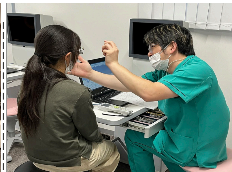
検査は誰でもできるようになります

今年1月から医療事務パートとして勤務しています。ベテランの先輩が丁寧に教えてくれるので未経験の私でも数回目から仕事ができるようになりました。親切に教えていただけますしアットホームな環境なので楽しいです。